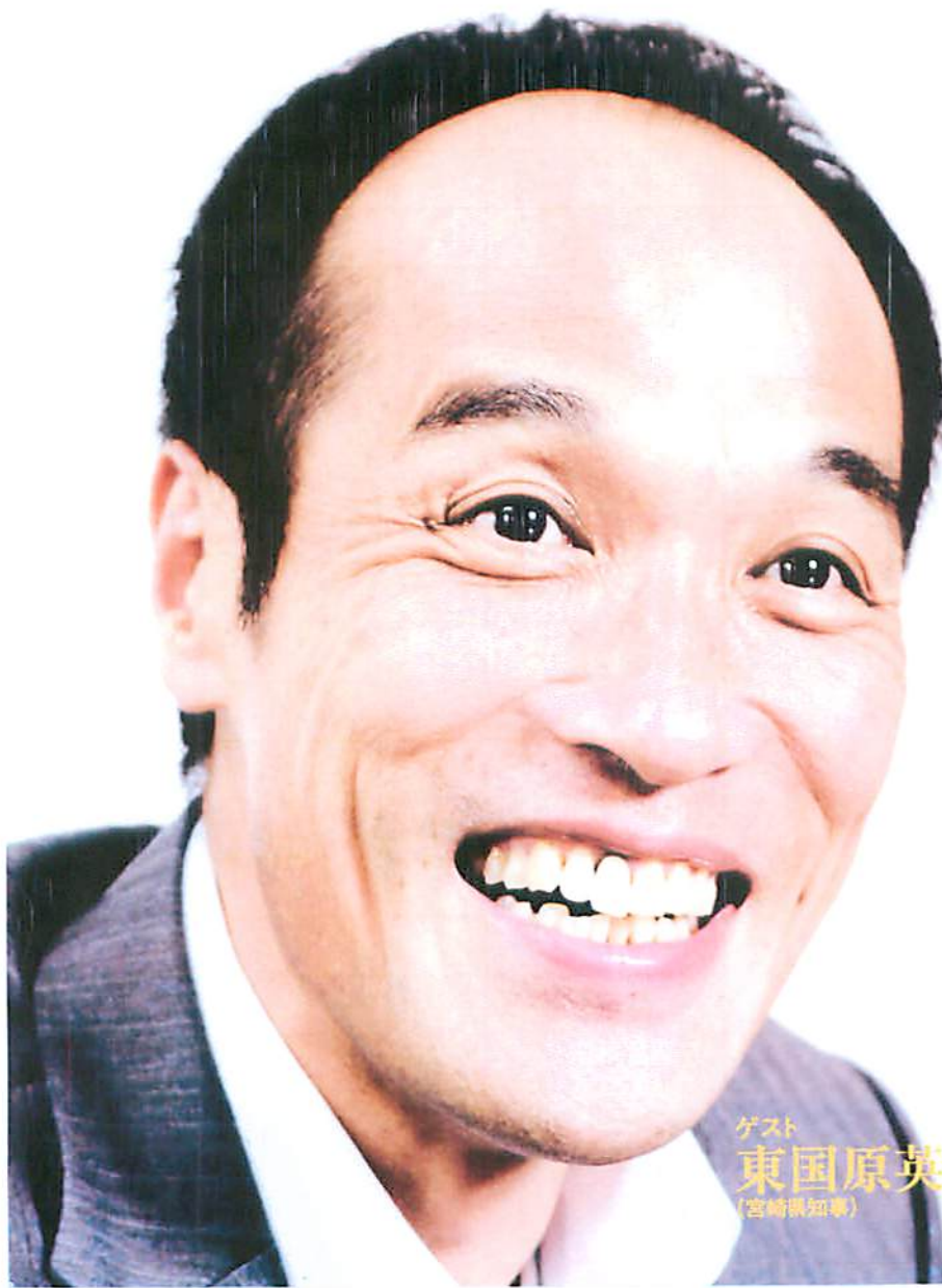
ゲスト 東国原英夫 (宮崎県知事)