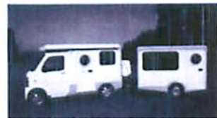
「テントむし」とキャンピングトレーラー「コロ」

グカーに、後部座席には対面・対座シートやテーブル設置。就寝時はシートを倒すだけ。さらに、可動式の天井を上げれば、2段階になり、最大4人まで就寝可能。高さは2m以下なので、マンションの地下駐車場や立体駐車場などでも利用できる。価格